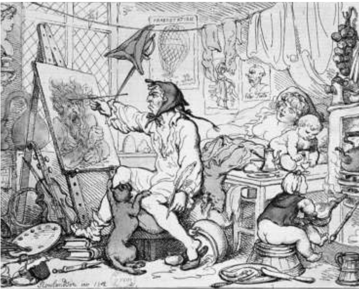
Thomas Rowlandson: The Chamber of Genius

ligere års erfaringer, men vær åpen for at ting kan endre seg. Nystartede foreninger bør rådføre seg med flere andre foreninger, RBR kan bistå med å formidle kontakt. I utgangspunktet bør man spre innkjøpene så mye som mulig så lenge man handler med seriøse gallerier. På denne måten sikrer man større variasjon og man unngår det tidligere nevnte presset ved å måtte handle mye på en gang. Så kommer vi til et spørsmål som har vært diskutert siden den første bedriftskunstforeningen ble dannet, skal man handle hos gallerier eller direkte fra kunstnerne. Svaret er i grunnen gitt av kunstnerne selv i det de fleste av dem ønsker seg livskraftige gallerier som kan formidle deres kunst på en profesjonell måte ved tilstedeværelse i sentrale strøk hvor de fleste kundene er. I et galleri kan du fritt velge hvilke kunstnere du vil kjøpe av, har du gjort en avtale med en kunstner så skal du være tøff om du går derfra uten å ha kjøpt noe. Det er nok kjøpepress om du ikke skal skape det selv.