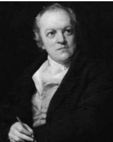
Portrett av William Blake