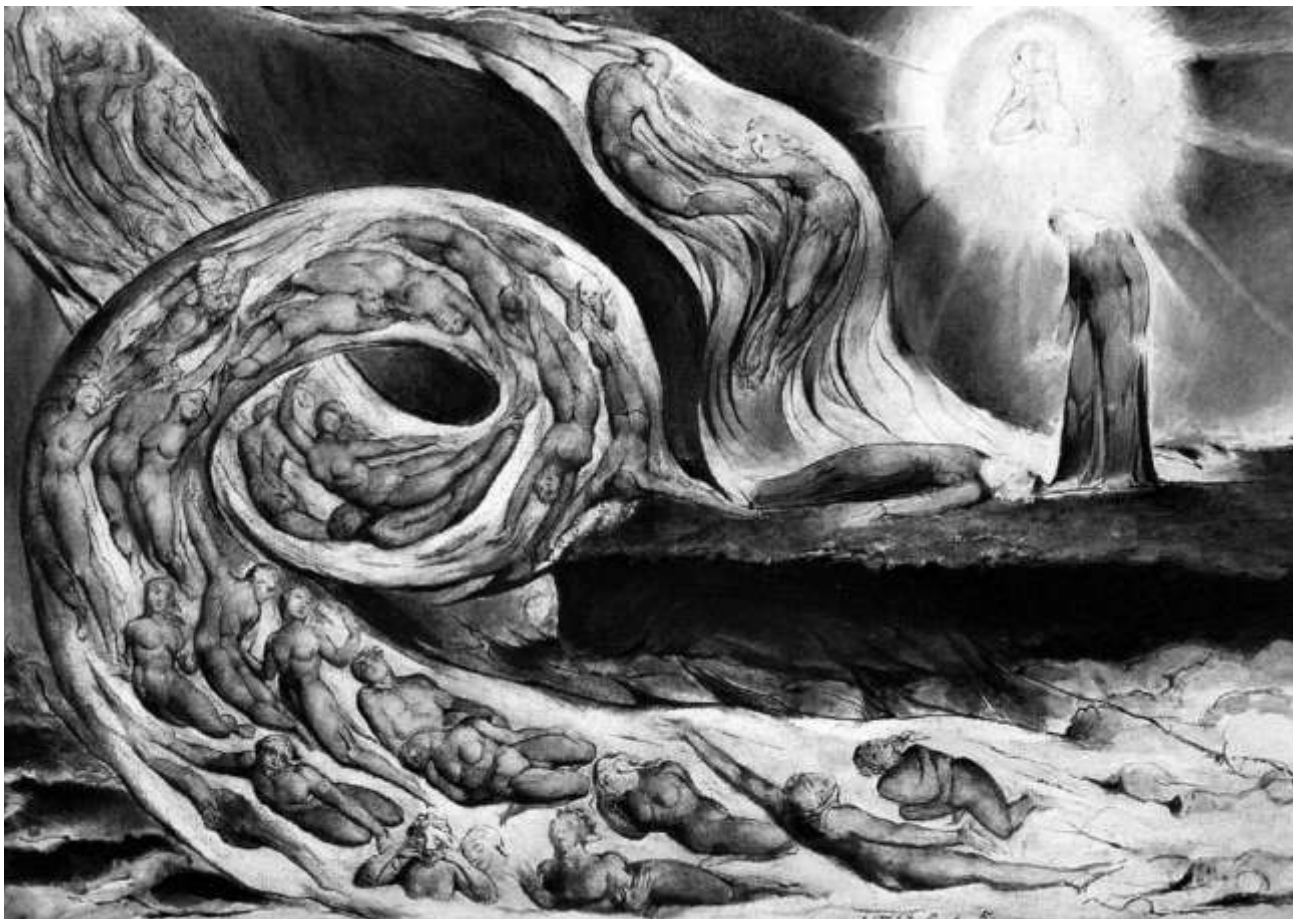
Inferno: Canto V

Dante Alighieri: Inferno (The Folio Society, 1998)