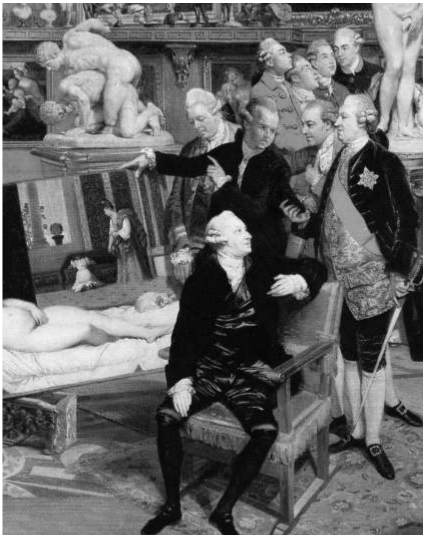
Johann Zoffany: The Tribuna at the Uffizi , utsnitt

Jeg avslutter der jeg begynte, med formålsparagrafen. Den er det viktigste verktøyet vi har, den skal ligge til grunn for all aktivitet i en bedriftskunstforening. Og ikke minst i en innkjøpskomité hvor den bør sitte i ryggmargen på medlemmene. Her er det veldig viktig å "stimulere til økt kunnskap og forståelse av god kunst". Å være medlem i en slik komité forplikter nemlig til å øke sin kompetanse. Dette kan man gjøre ved for eksempel å delta på RBRs seminarer, gå på Grafisk Verksted når de har åpent hus og i det hele tatt bruke de muligheter som tilbys. I tillegg bør man gå jevnlig på utstillinger, spesielt når det tilbys omvisning. Er man ute og reiser så krever ikke så stor innsats å sjekke om det finnes et godt kunstmuseum i nærheten, i de fleste byer i Europa kan man se stor kunst. Av og til sendes det gode programmer om kunst på NRK2, oftere på svensk TV1 og TV2 hvis man har tilgang. Bøker om kunst finnes det mye av, og om du ikke finner de i bokhandelen så kan jeg i alle fall til dette formålet anbefale internet. Vil du ikke kjøpe så har vi heldigvis gode bibliotek i dette landet. I tillegg finnes det også spesialiserte tidsskrift om kunst, noen har vært omtalt i RBR Rapport. En innkjøpskomité som på denne måten kan bygge opp sin kompetanse på kunst er den beste garantien for gode innkjøp. Selvfølgelig skal det foregå en viss rotasjon samtidig som man må søke å ha en god kontinuitet. Og det er like enkelt og like vanskelig som alt annet i livet. Lykke til!